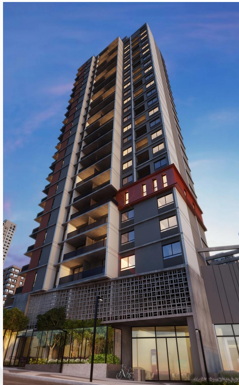
VN TURIASSÚ 1473