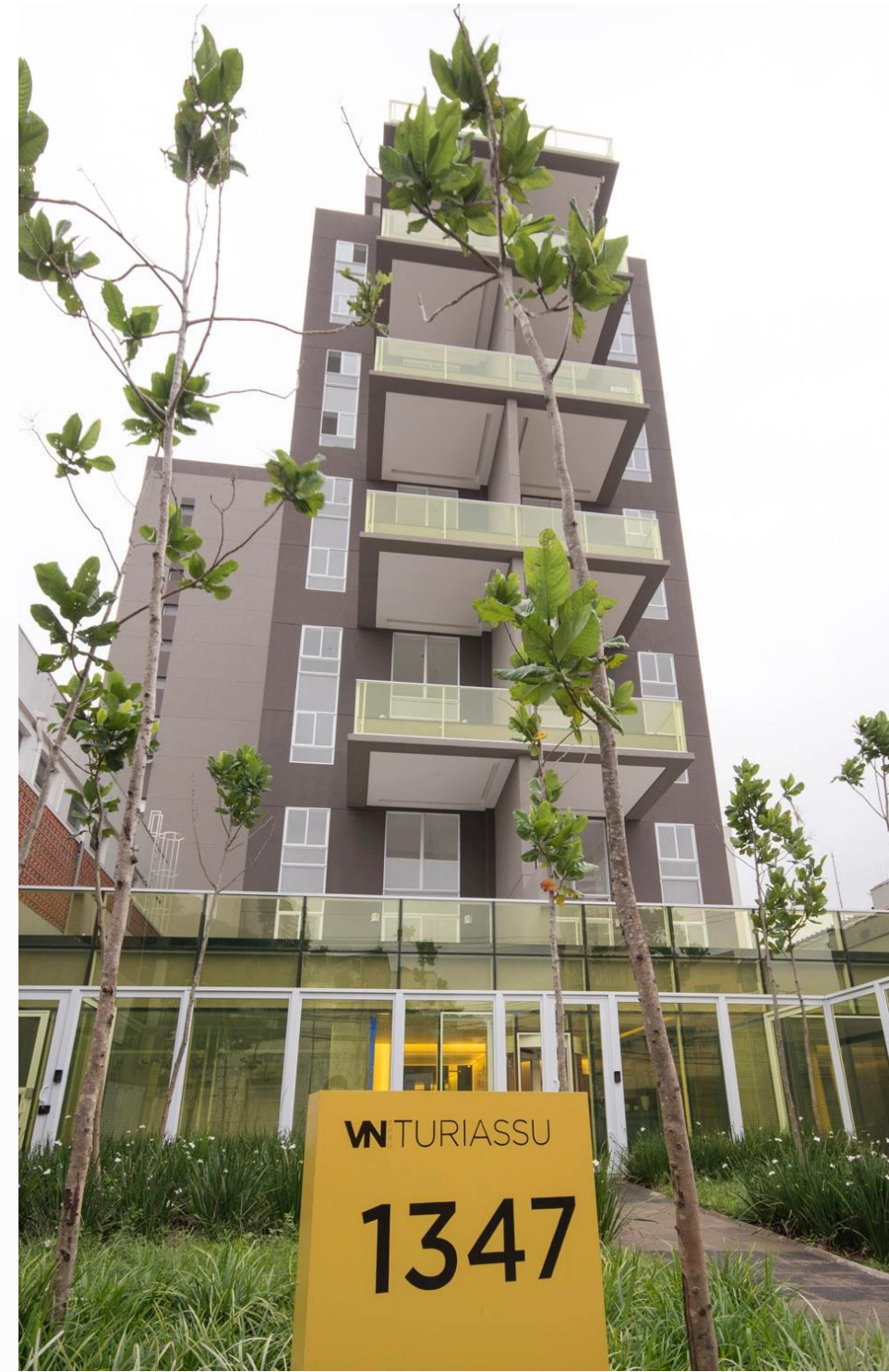
VN TURIASSÚ 1347