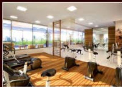
PERSPECTIVA ARTÍSTICA DO ESPAÇO FITNESS