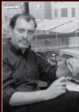
ARQUITETO: JONAS BERGER

UM MODELO MULTIUSO DIFERENCIADO QUE VALORIZA AS PESSOAS, SEUS AMBIENTES E SUAS ATIVIDADES.