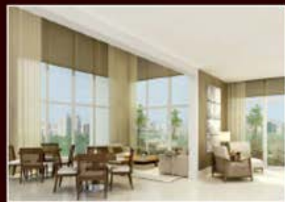
PERSPECTIVA ARTÍSTICA DO SALÃO DE FESTAS