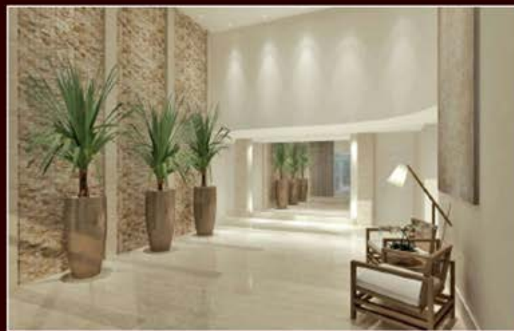
PERSPECTIVA ARTÍSTICA DO HALL SOCIAL

FOR LIVE É TOTALMENTE INDEPENDENTE, MAS INTEGRADA A UMA MODERNA TORRE EMPRESARIAL - FOR WORK, PROPORCIONANDO INÚMERAS FACILIDADES E BENEFÍCIOS AOS SEUS MORADORES.