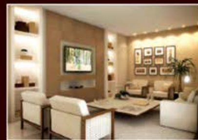
PERSPECTIVA ARTÍSTICA DO HOME THEATER