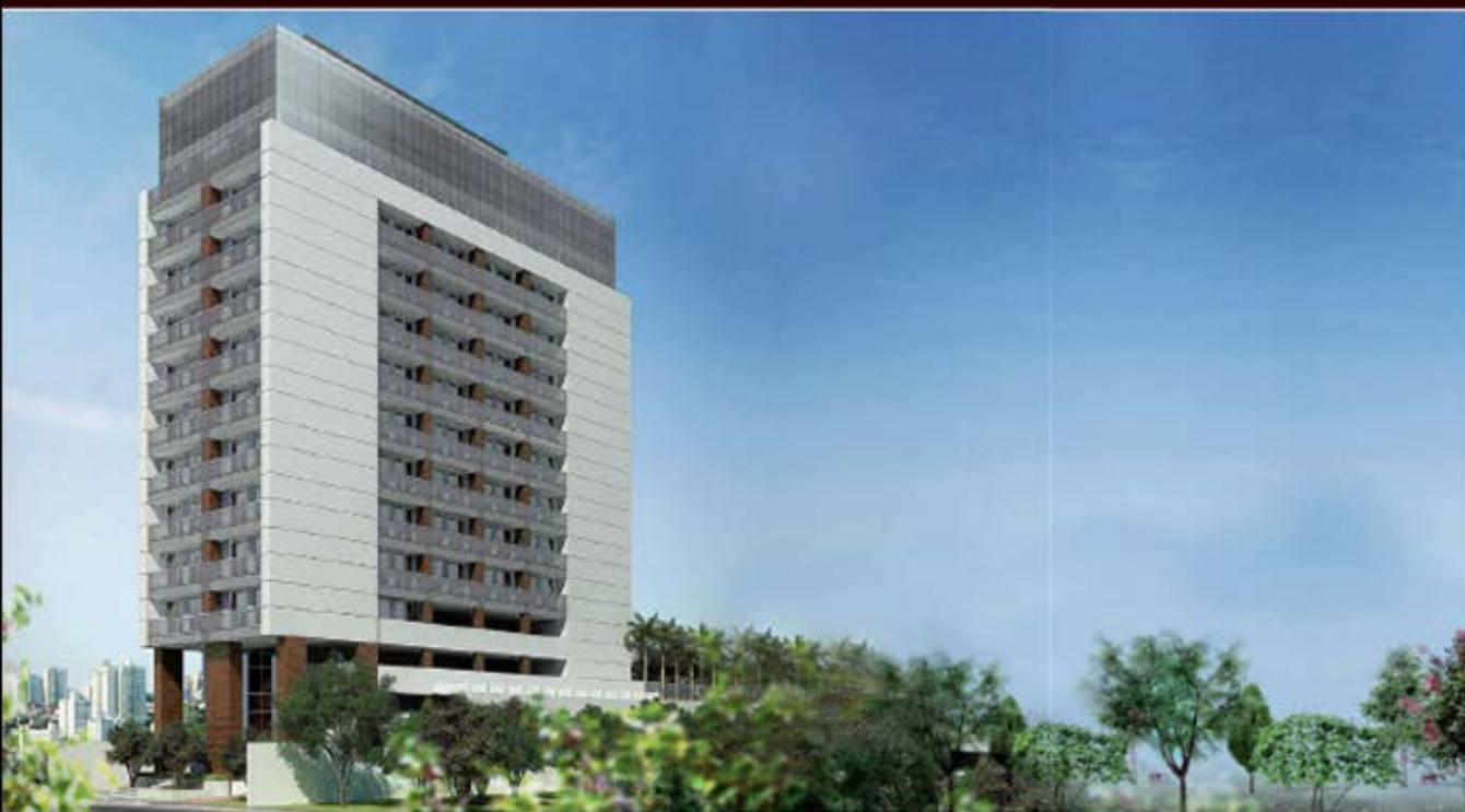
PERSPECTIVA ARTÍSTICA DA FACHADA