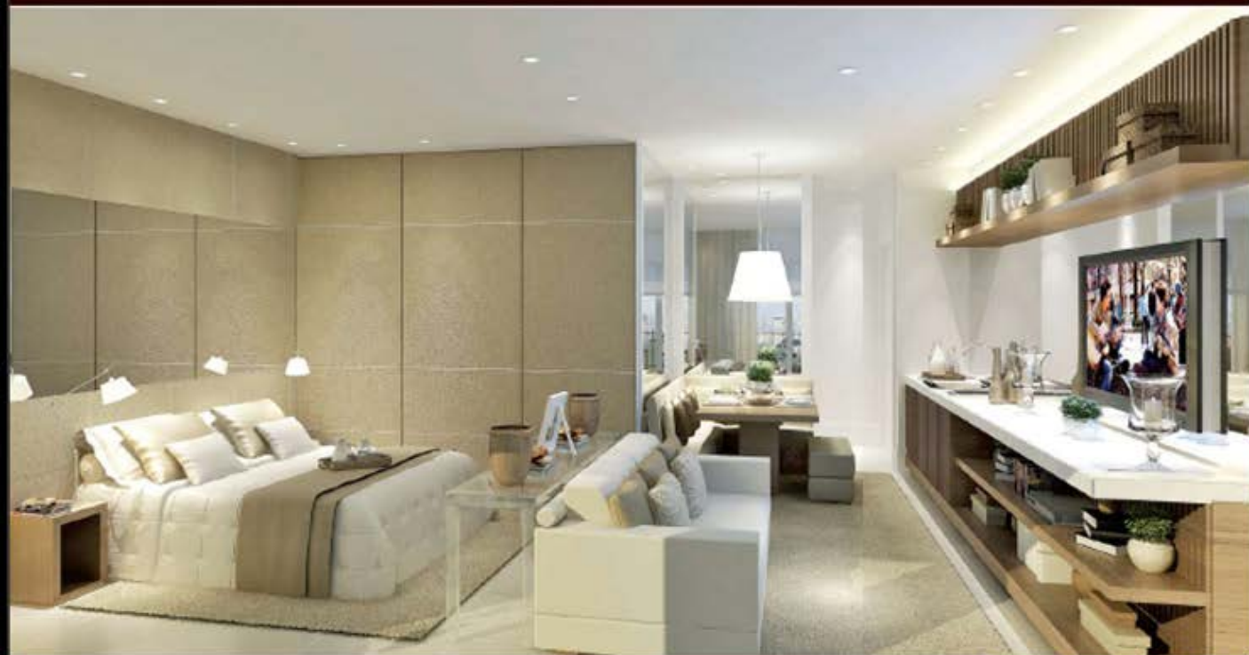
PERSPECTIVA ARTÍSTICA DO LIVING INTEGRADO