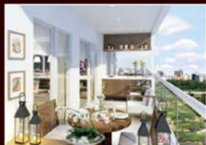
PERSPECTIVA ARTÍSTICA DO TERRAÇO OÙRNET

A elegância e satisfação dos espaços são garantidas através da utilização de peças de design, materiais nobres, como madeira, mármore e pinturas especiais, combinados aos tecidos em tons de cinza, bege e detalhes em marrom. A torre residencial possui apartamentos de 43 m 2 que podem ser unificados entre si, atendendo a uma necessidade de utilização mais abrangente e variada. A torre de escritórios, por sua vez, apresenta tipologia a partir de 34 m 2 , um espaço compacto, reunindo ao mesmo tempo conforto e segurança no coração da Vila Olímpia." DEBORA AGUIAR