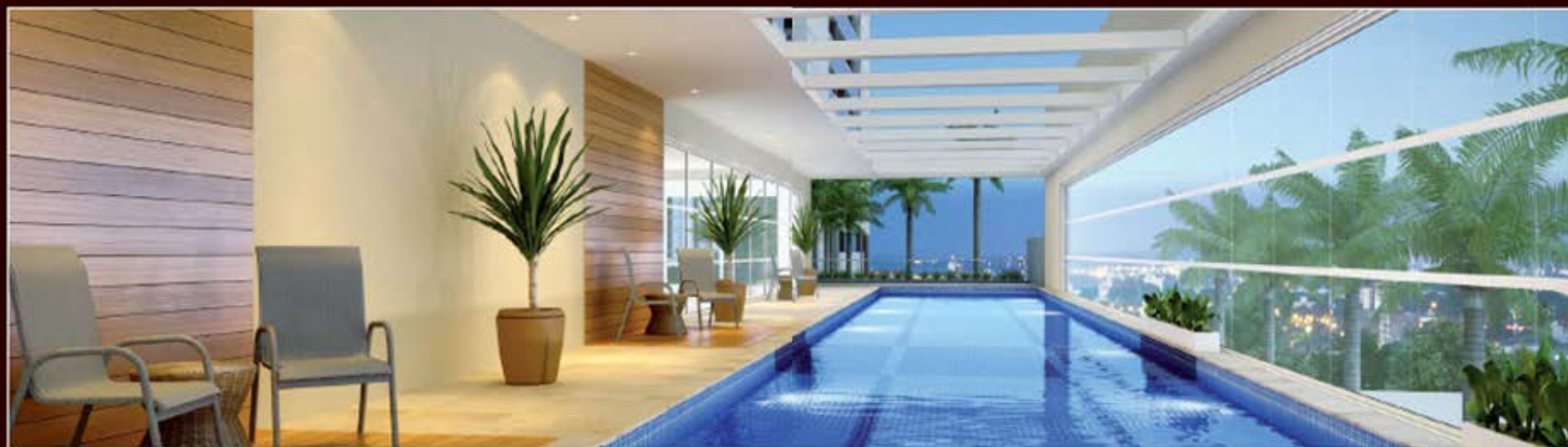
PERSPECTIVA ARTÍSTICA DA PISCINA