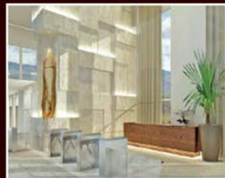
PERSPECTIVA ARTÍSTICA DO LOBBY COMERCIAL

UM EMPREENDIMENTO EXCLUSIVO, ONDE SEU PROJETO ARQUITETÔNICO TRANSFORMA AMBIENTES DE TRABALHO EM VERDADEIROS ESPAÇOS DE INOVAÇÃO, CRIATIVIDADE E FUNCIONALIDADE.