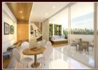
PERSPECTIVA ARTÍSTICA DO ESPAÇO GAME