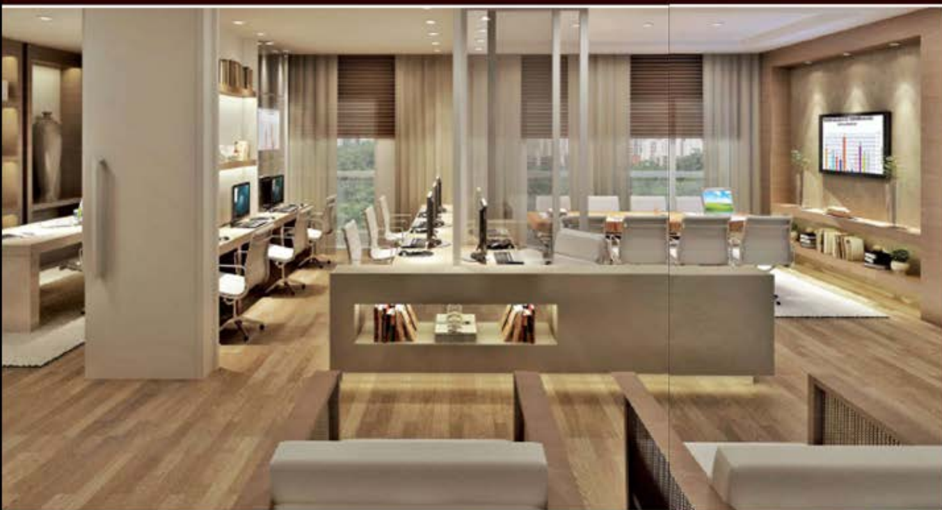
PERSPECTIVA ARTÍSTICA DA JUNÇÃO DE 68,80 M 2