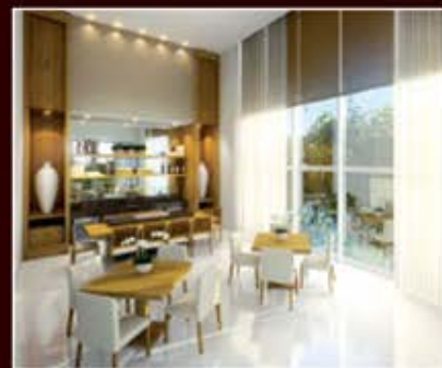
PERSPECTIVA ARTÍSTICA DO ESPAÇO GOURMET