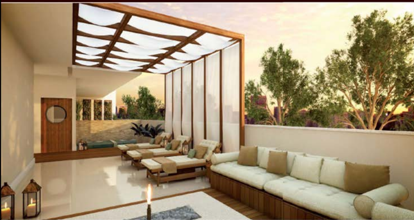
PERSPECTIVA ARTÍSTICA DO SPA INTEGRADO A SALINA