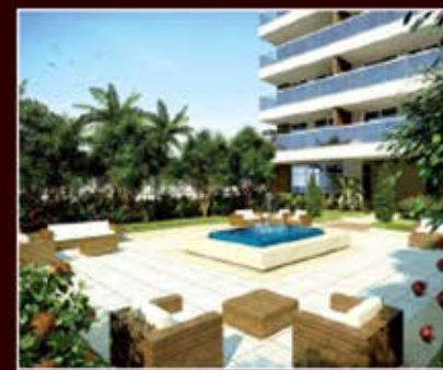
PERSPECTIVA ARTÍSTICA DA PRAÇA CENTRAL