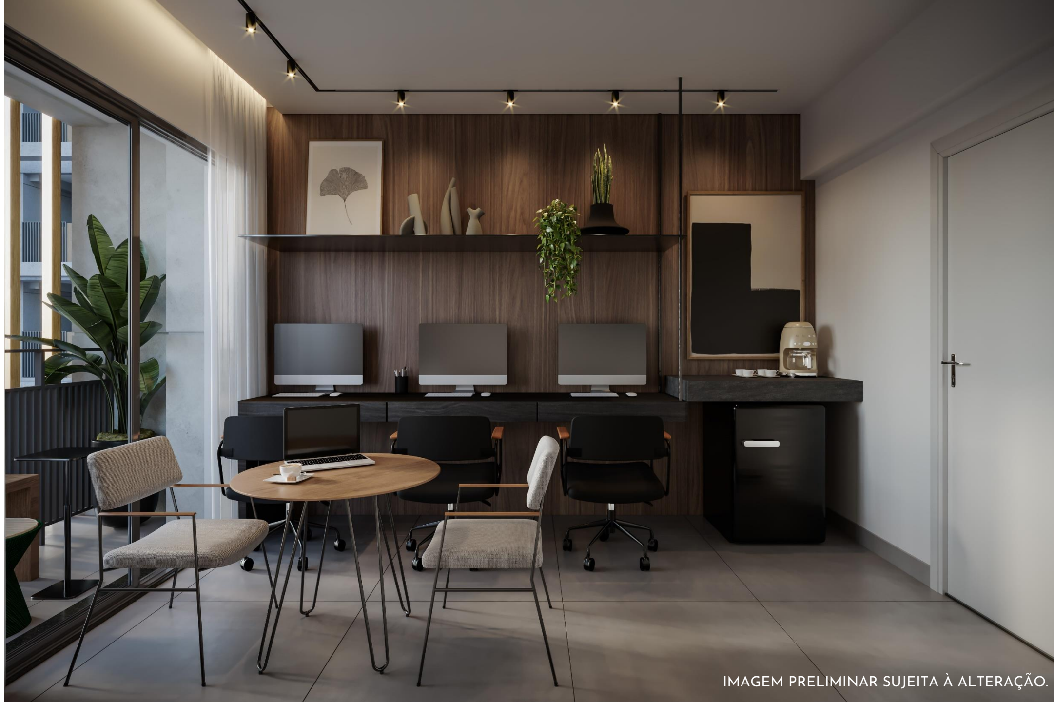
IMAGEM PRELIMINAR SUJEITA À ALTERAÇÃO.