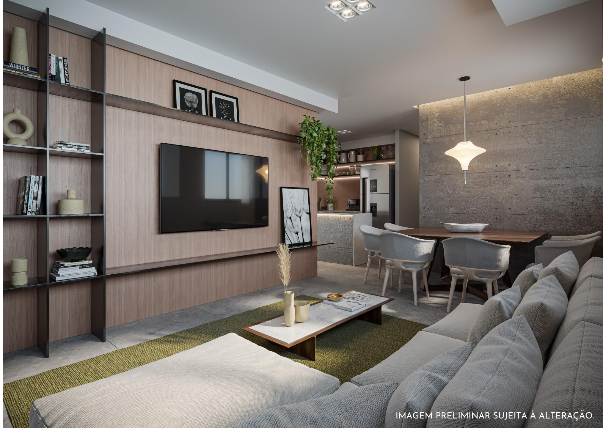
IMAGEM PRELIMINAR SUJEITA À ALTERAÇÃO.