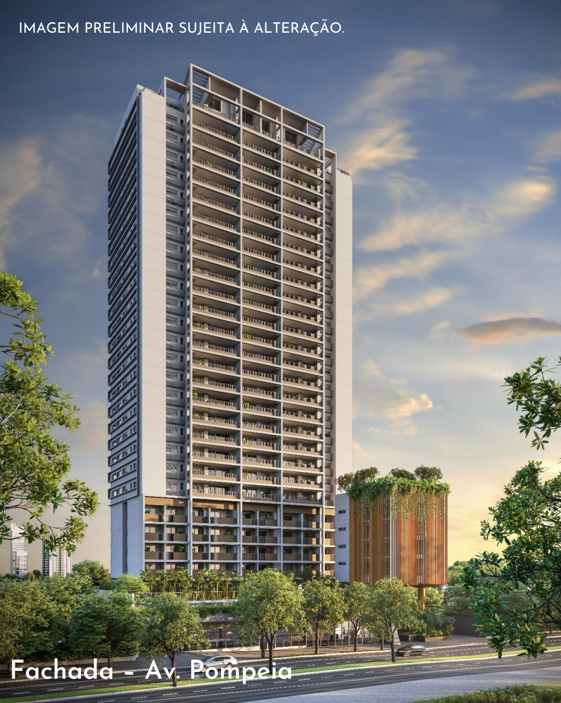
Fachada – Av. Pompeia