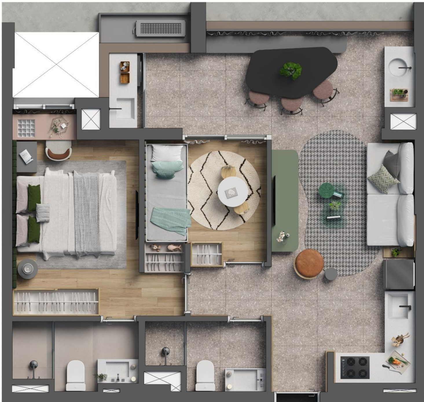
RESIDENCE 60m 2