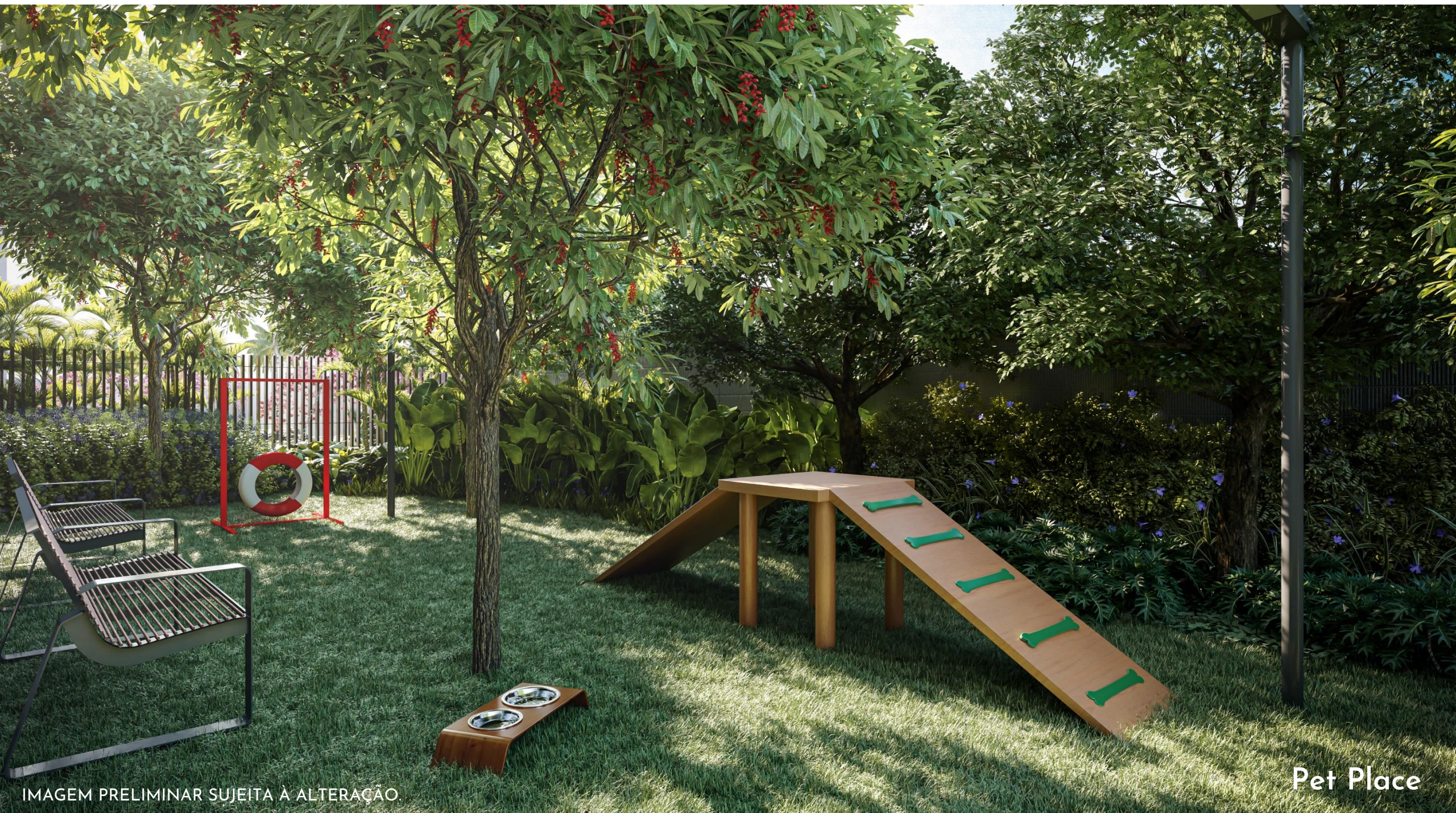
IMAGEM PRELIMINAR SUJEITA À ALTERAÇÃO.