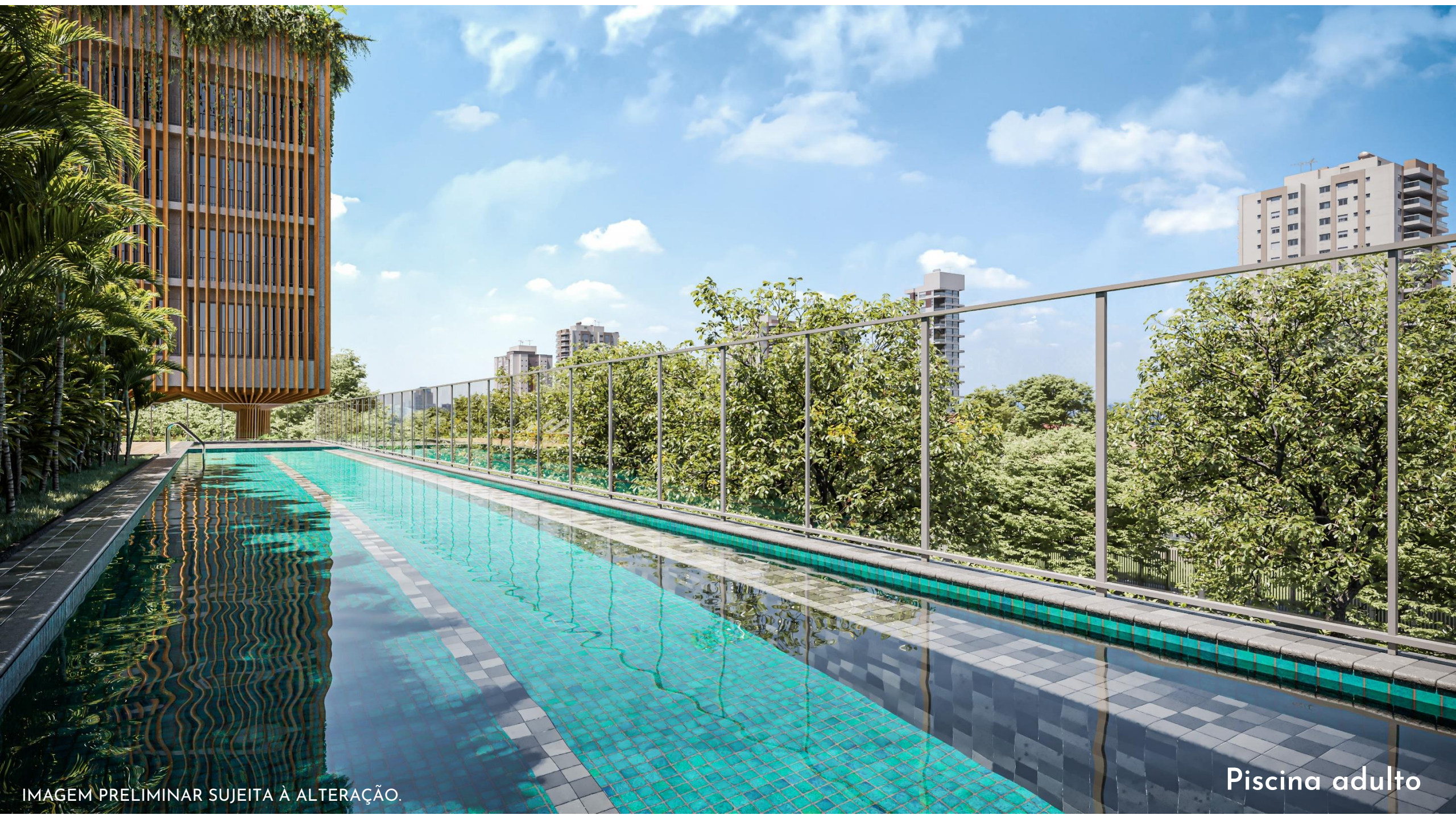
IMAGEM PRELIMINAR SUJEITA À ALTERAÇÃO.