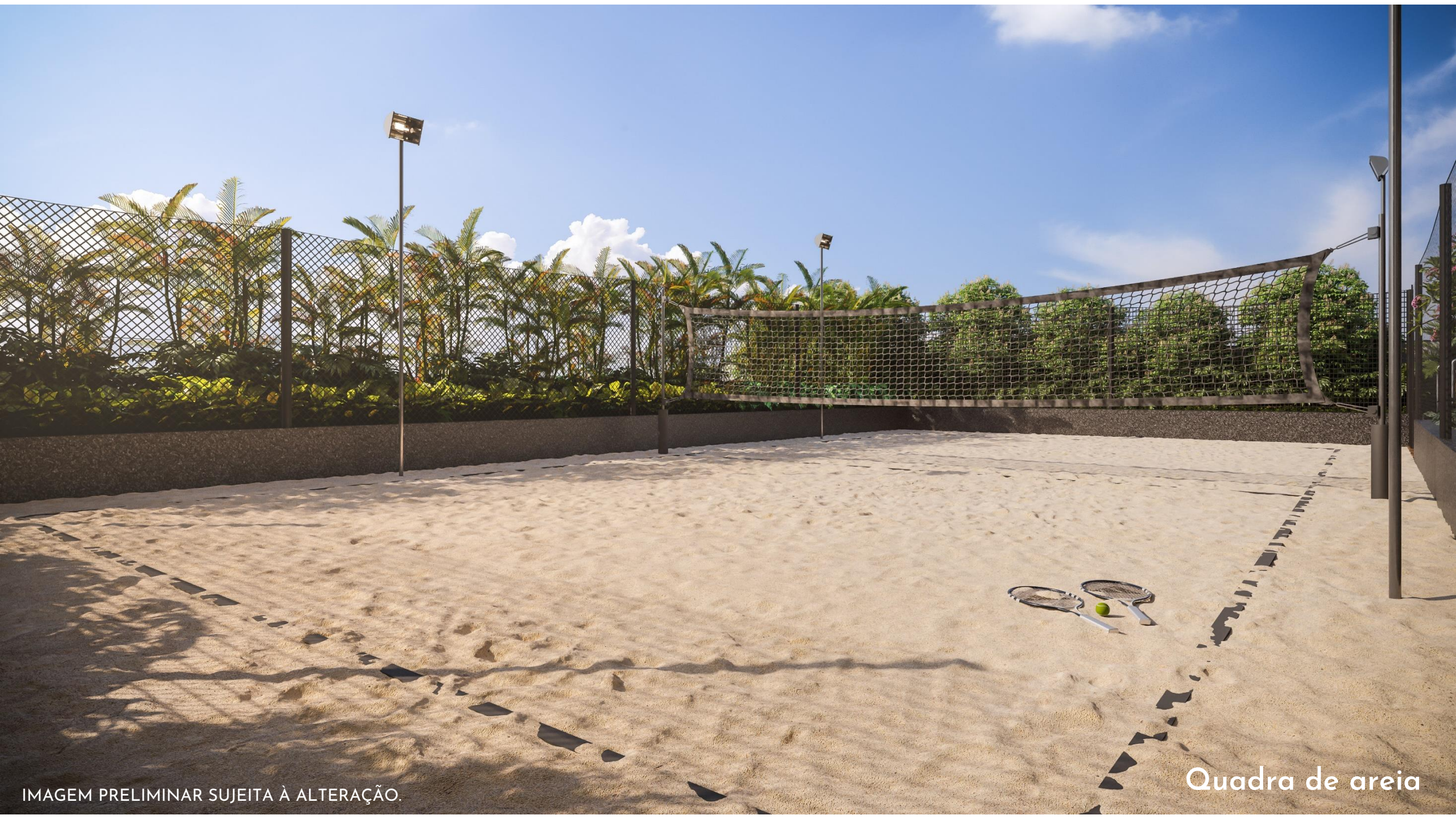
IMAGEM PRELIMINAR SUJEITA À ALTERAÇÃO.