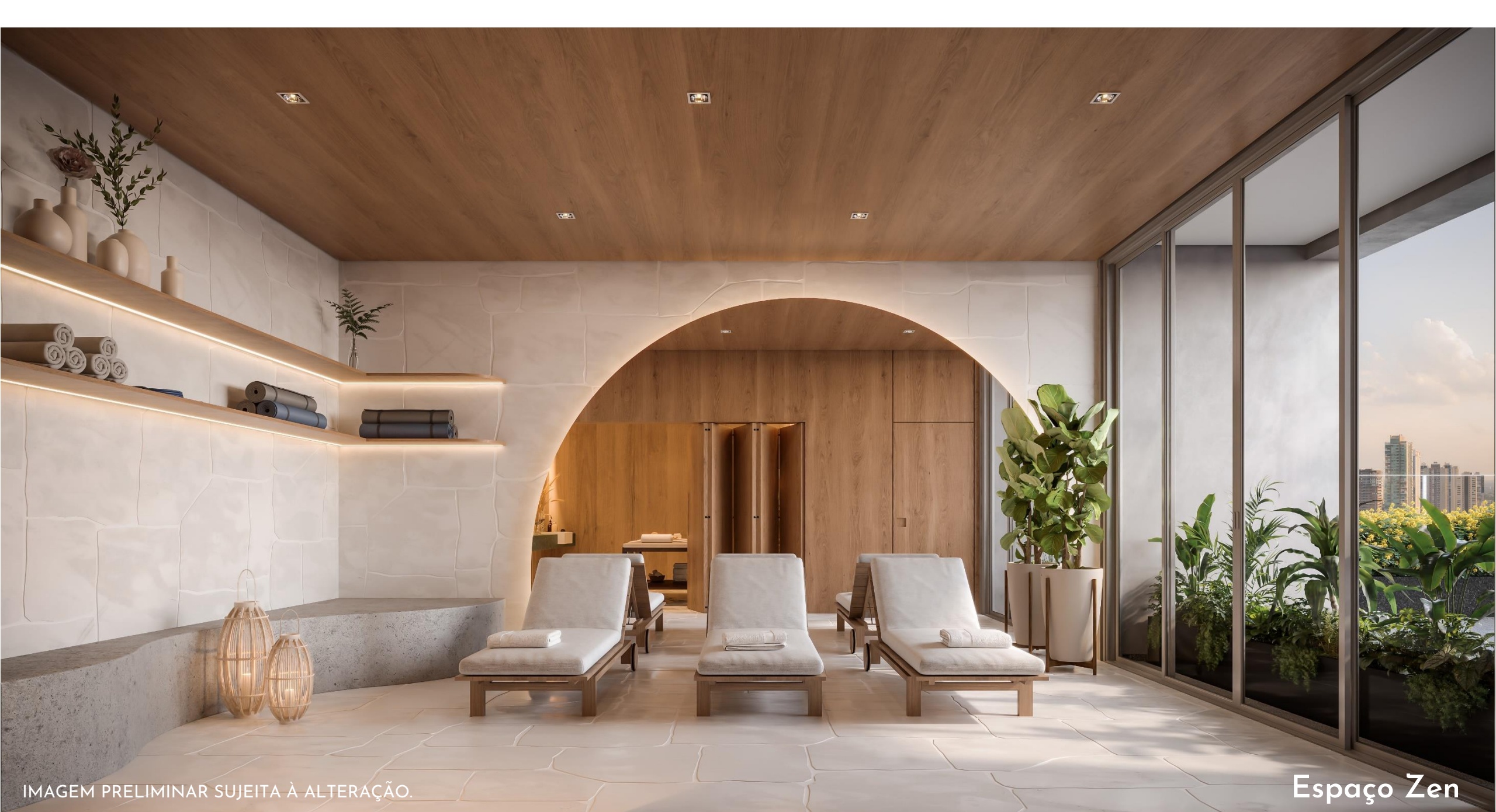
IMAGEM PRELIMINAR SUJEITA À ALTERAÇÃO.