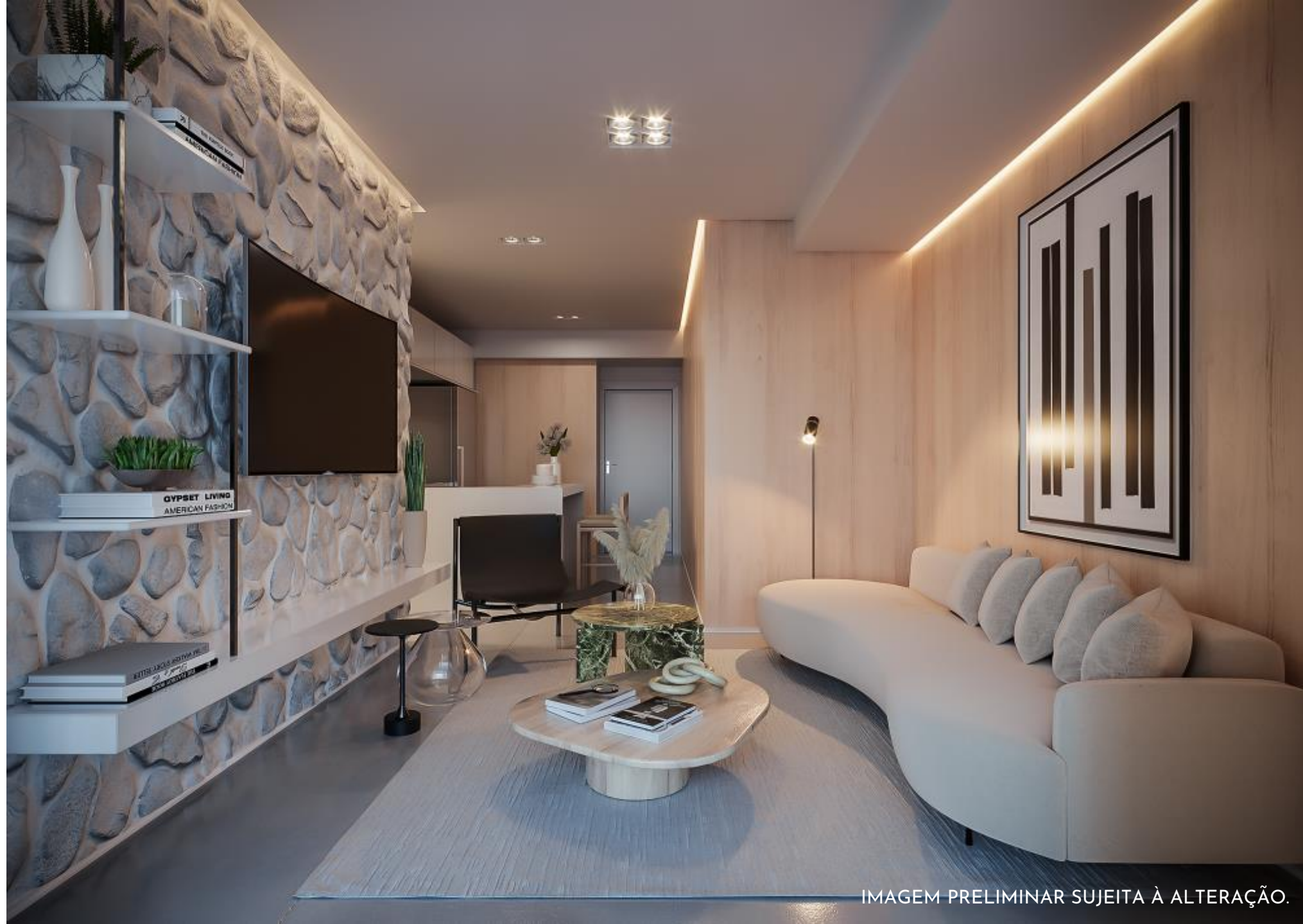
IMAGEM PRELIMINAR SUJEITA À ALTERAÇÃO.