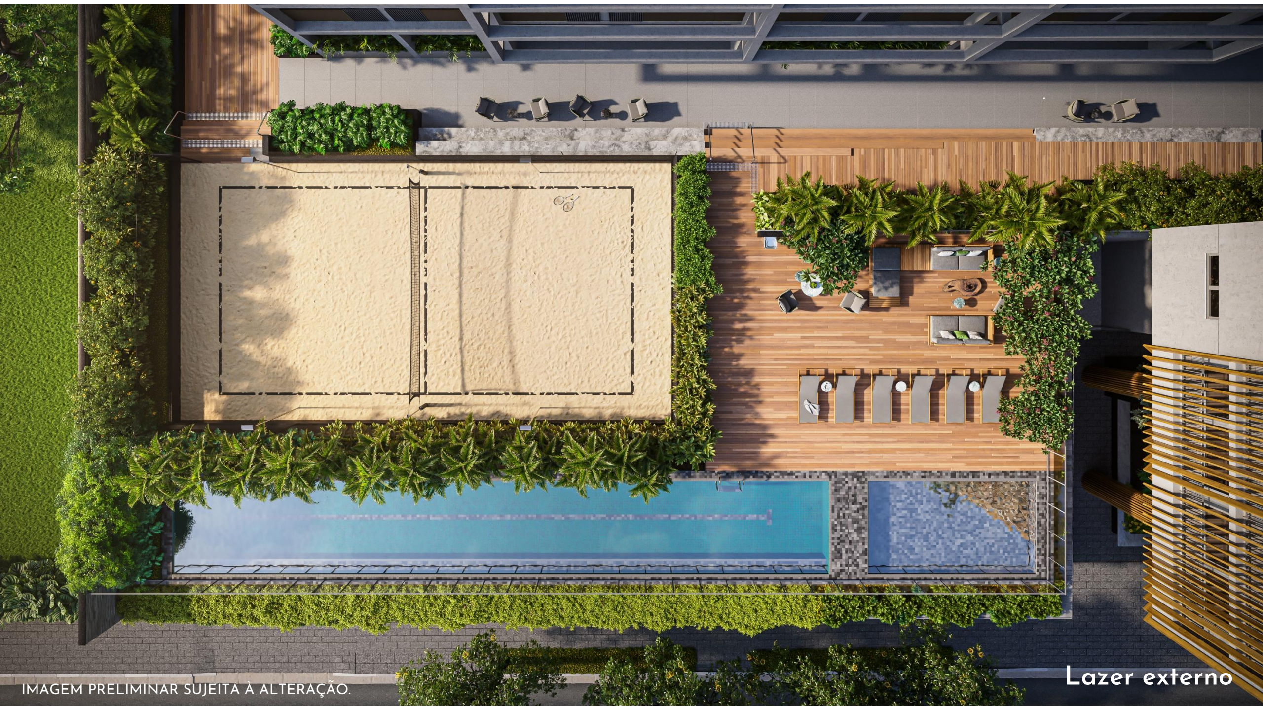
IMAGEM PRELIMINAR SUJEITA À ALTERAÇÃO.