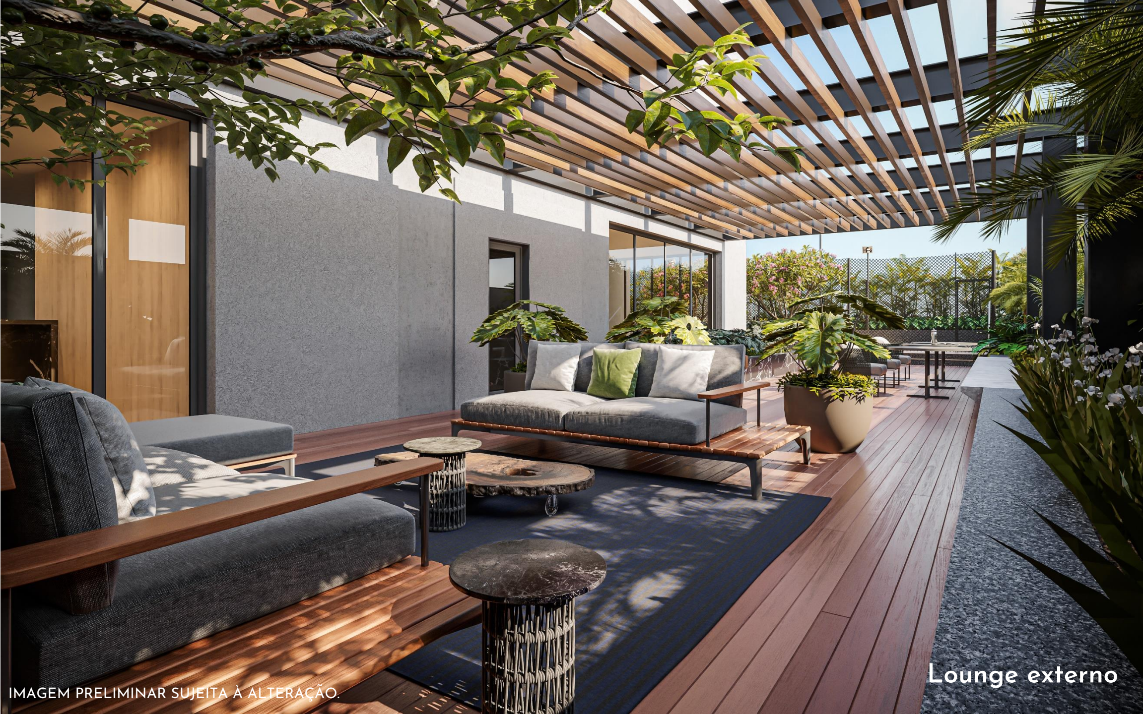
IMAGEM PRELIMINAR SUJEITA À ALTERAÇÃO.