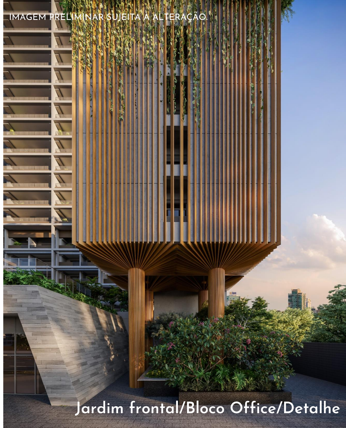
Jardim frontal/Bloco Office/Detalhe