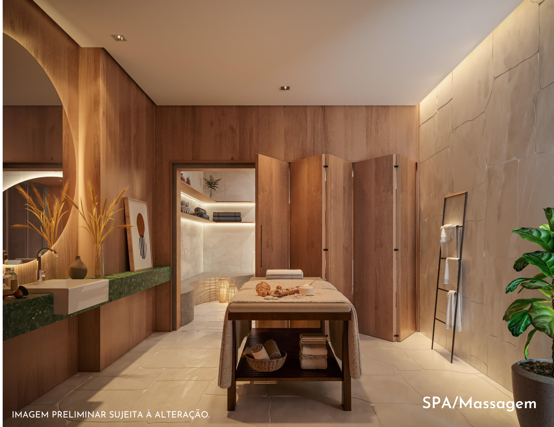
IMAGEM PRELIMINAR SUJEITA À ALTERAÇÃO.