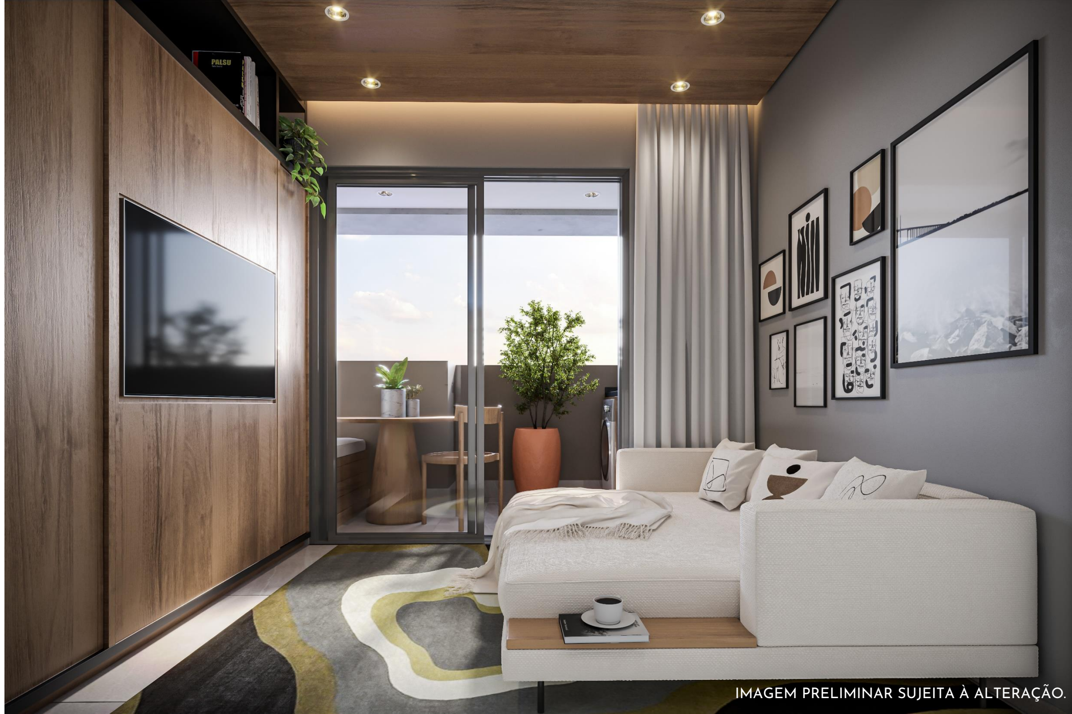
IMAGEM PRELIMINAR SUJEITA À ALTERAÇÃO.