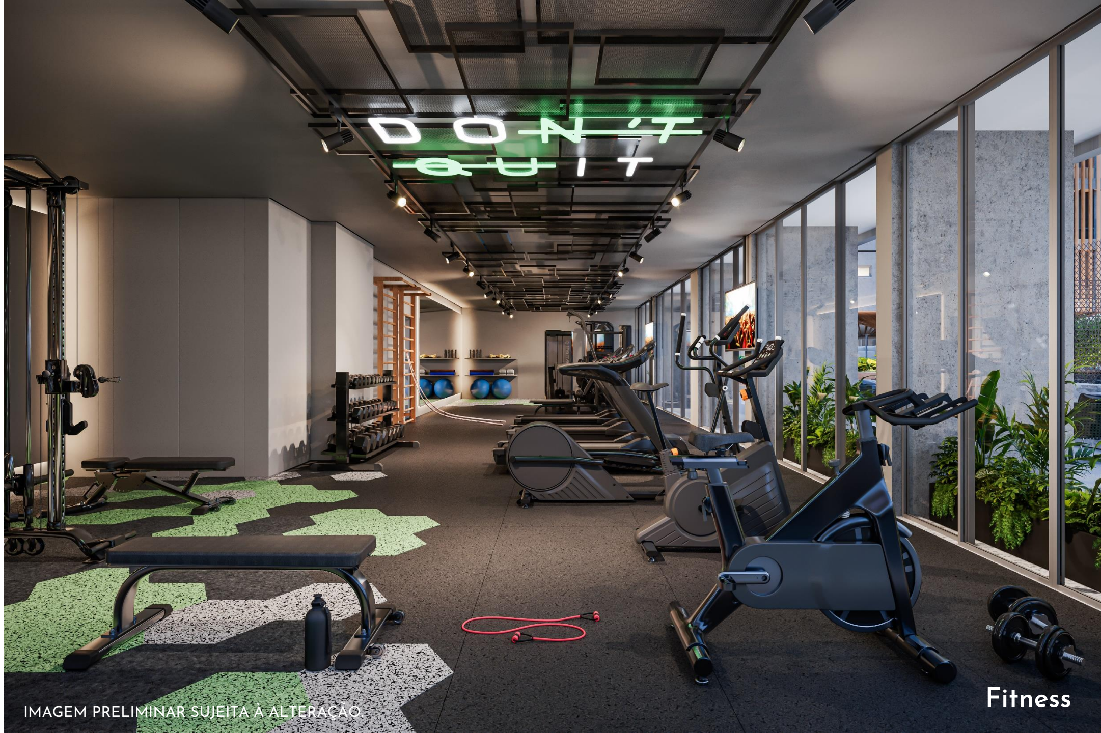
IMAGEM PRELIMINAR SUJEITA À ALTERAÇÃO