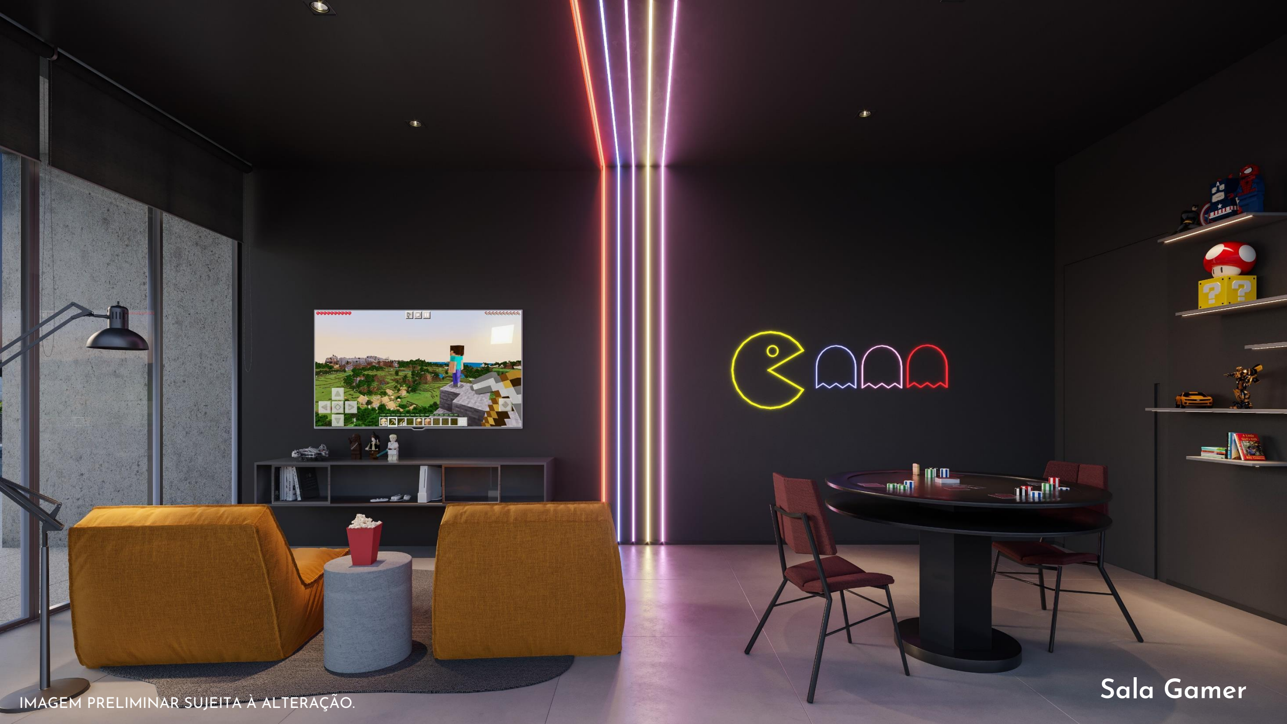
IMAGEM PRELIMINAR SUJEITA À ALTERAÇÃO.