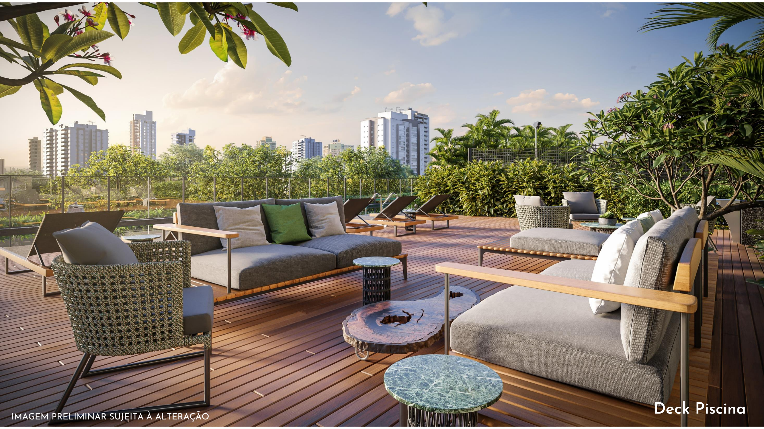
IMAGEM PRELIMINAR SUJEITA À ALTERAÇÃO.